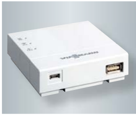
Vitoconnect 100 mit Anschlüssen für das Steckernetzteil (links) und zur Datenverbindung