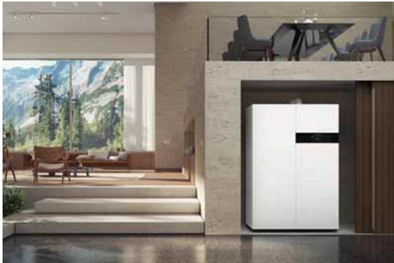
Brennstoffzellen-Heizgerät mit Spitzenlastkessel und Warmwasserspeicher

Mit der Brennstoffzelle durch eigene Stromerzeugung von steigenden Energiekosten unabhängig werden